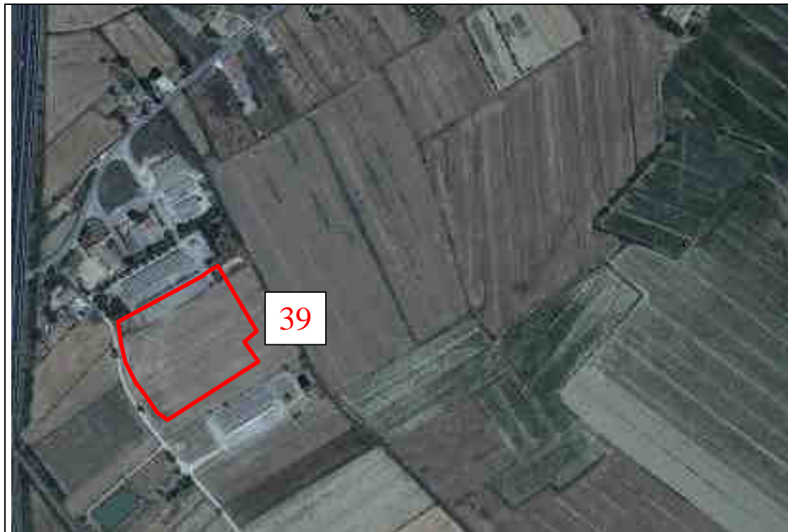
FOTO AEREA CON INDIVIDUAZIONE DELL'AREA INTERESSATA