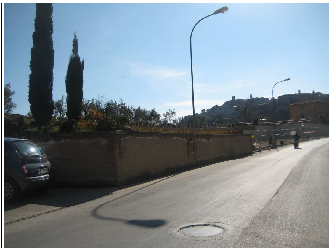
PARTICOLARE FOTOGRAFICO DA VIA BERNABEI