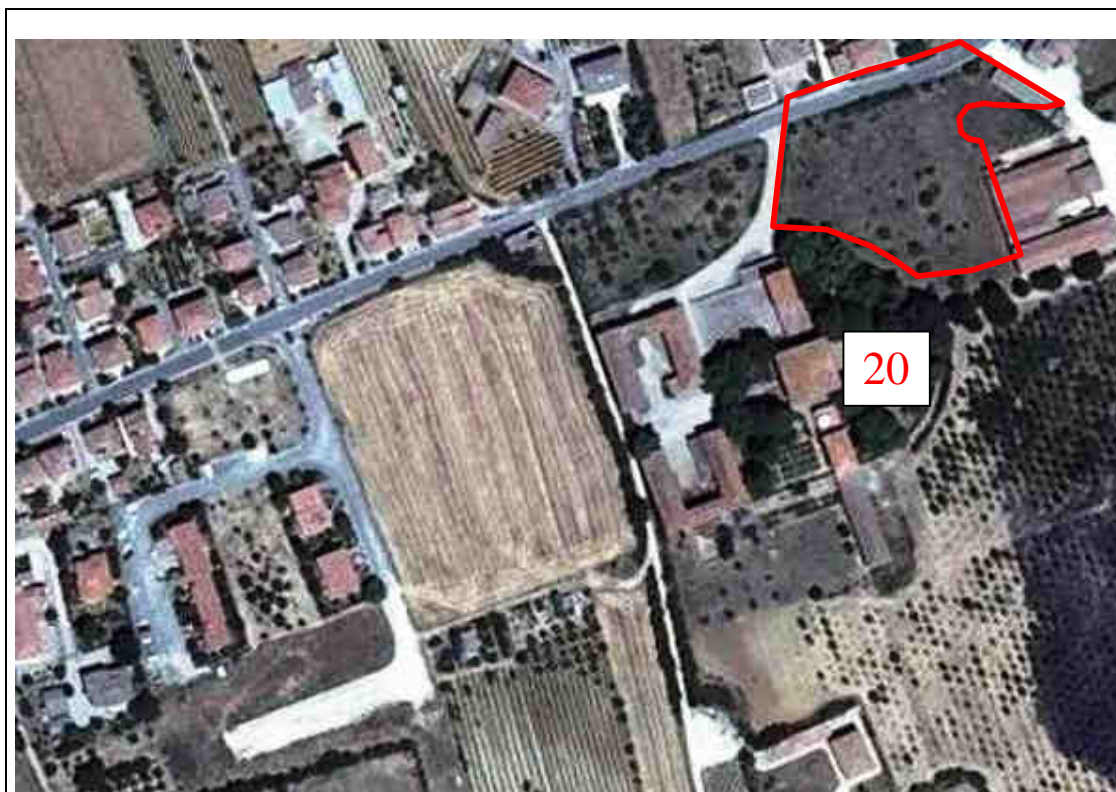
FOTO AEREA CON INDIVIDUAZIONE DELL'AREA INTERESSATA