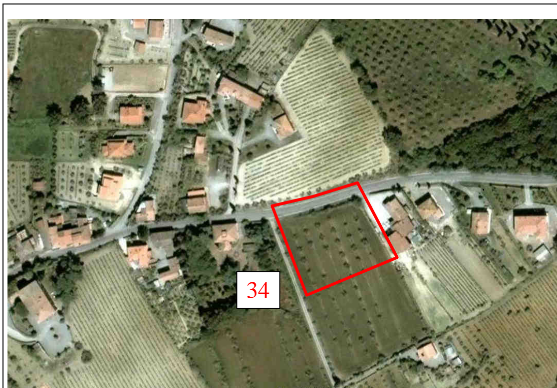
FOTO AEREA CON INDIVIDUAZIONE DELL'AREA INTERESSATA