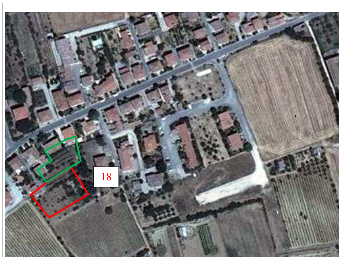
FOTO AEREA CON INDIVIDUAZIONE DELL'AREA INTERESSATA