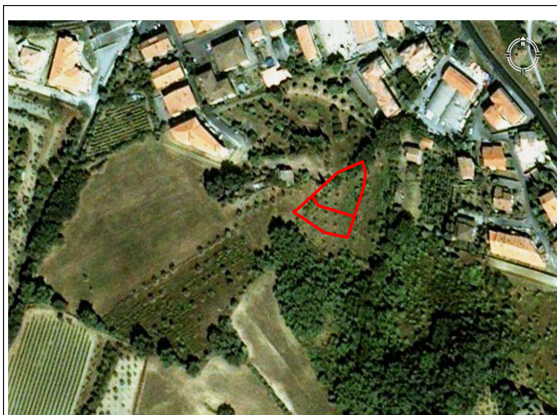
FOTO AEREA CON INDIVIDUAZIONE DELL'AREA INTERESSATA