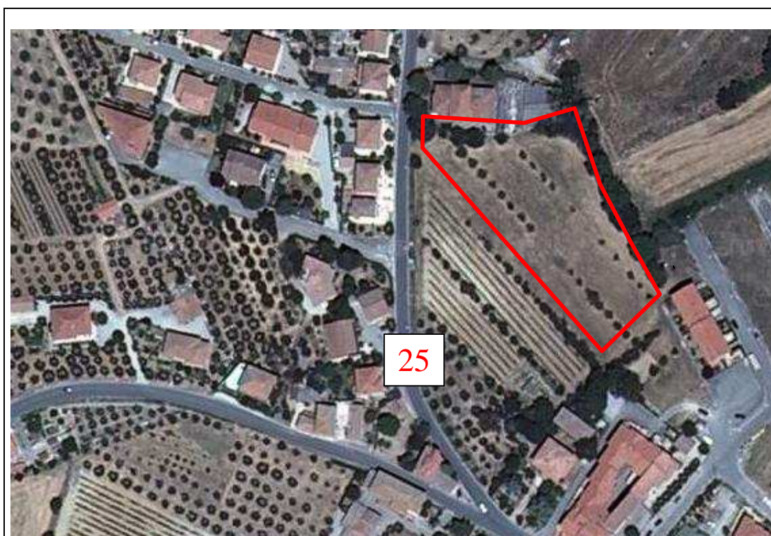
FOTO AEREA CON INDIVIDUAZIONE DELL'AREA INTERESSATA