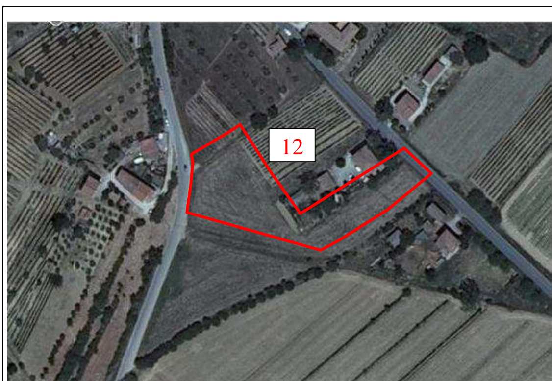
FOTO AEREA CON INDIVIDUAZIONE DELL'AREA INTERESSATA