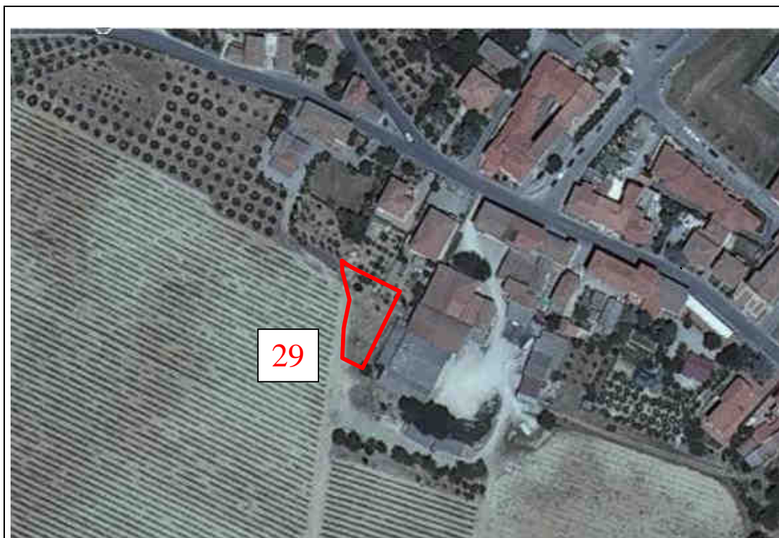
FOTO AEREA CON INDIVIDUAZIONE DELL'AREA INTERESSATA