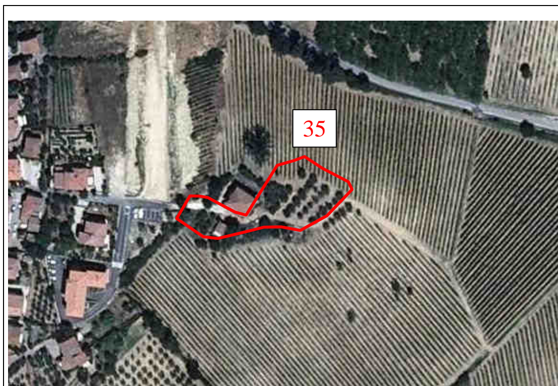
FOTO AEREA CON INDIVIDUAZIONE DELL'AREA INTERESSATA