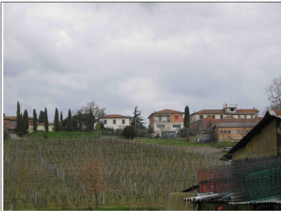
PARTICOLARE FOTOGRAFICO (30)