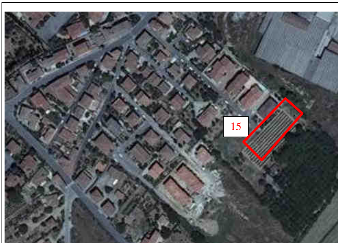
FOTO AEREA CON INDIVIDUAZIONE DELL'AREA INTERESSATA