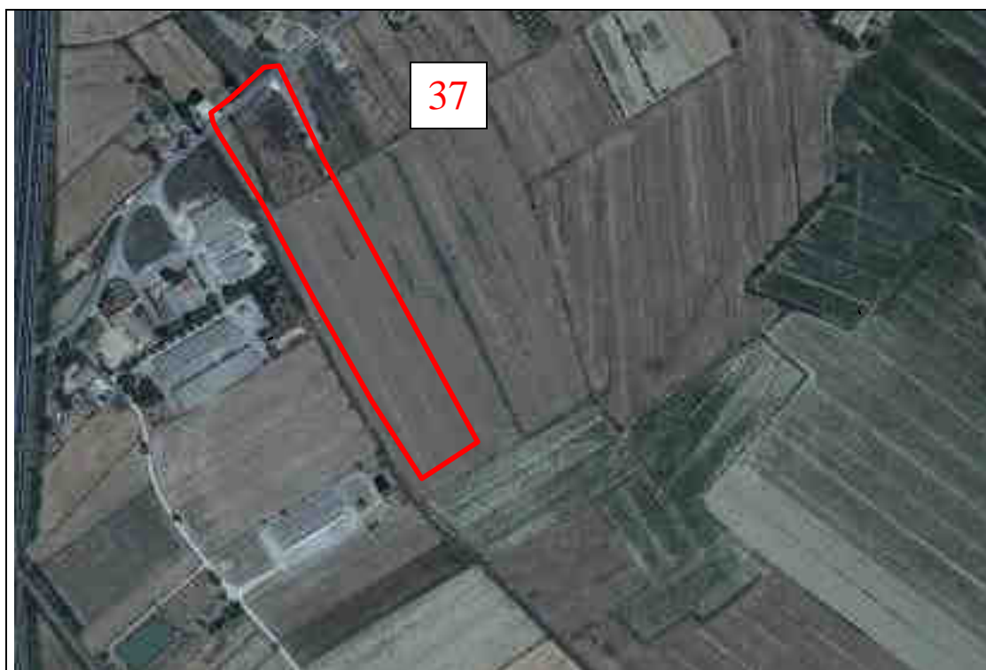
FOTO AEREA CON INDIVIDUAZIONE DELL'AREA INTERESSATA