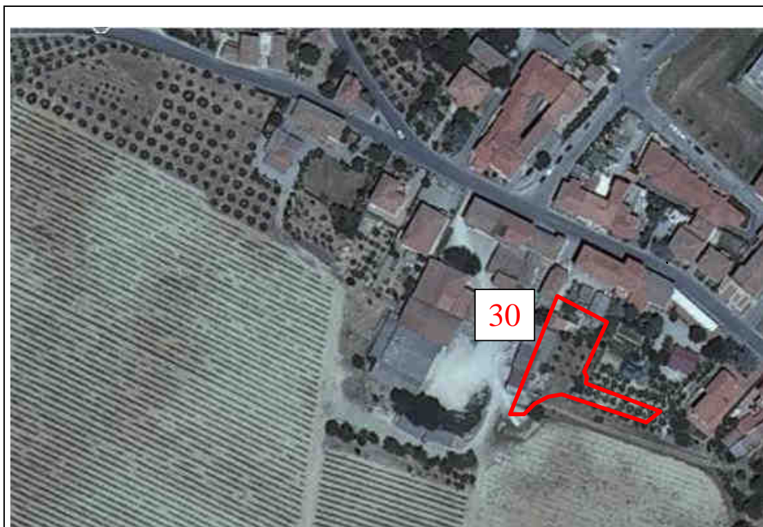
FOTO AEREA CON INDIVIDUAZIONE DELL'AREA INTERESSATA