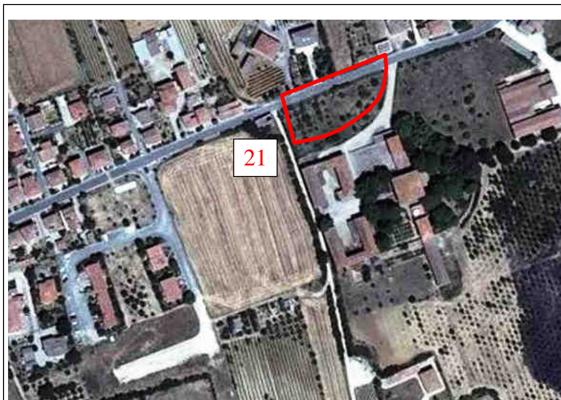
PARTICOLARE FOTOGRAFICO (20)