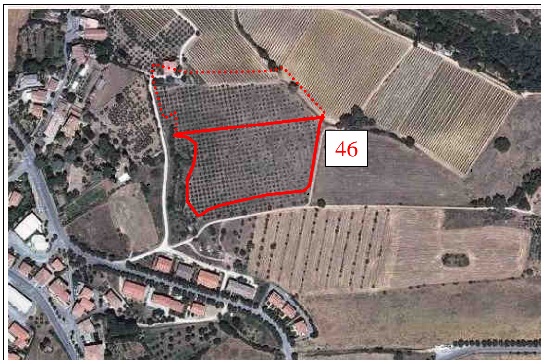
FOTO AEREA CON INDIVIDUAZIONE DELL'AREA INTERESSATA