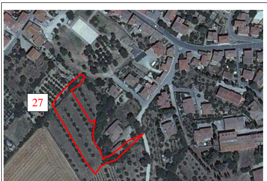
FOTO AEREA CON INDIVIDUAZIONE DELL'AREA INTERESSATA