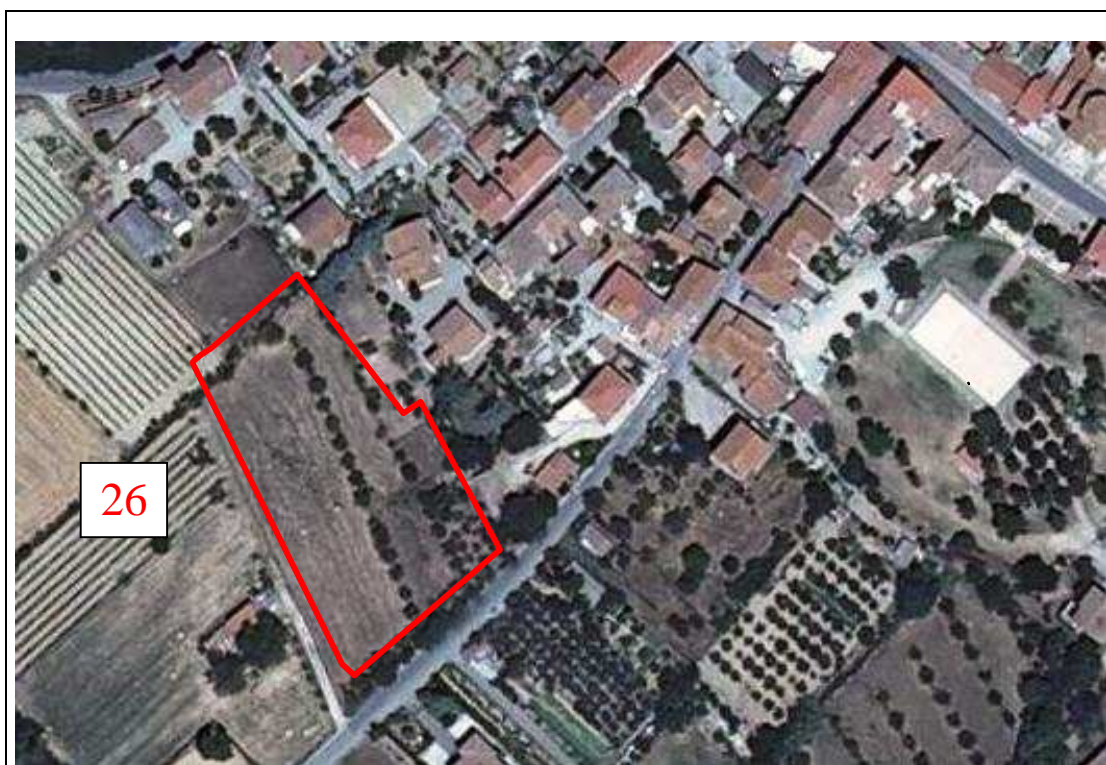
FOTO AEREA CON INDIVIDUAZIONE DELL'AREA INTERESSATA