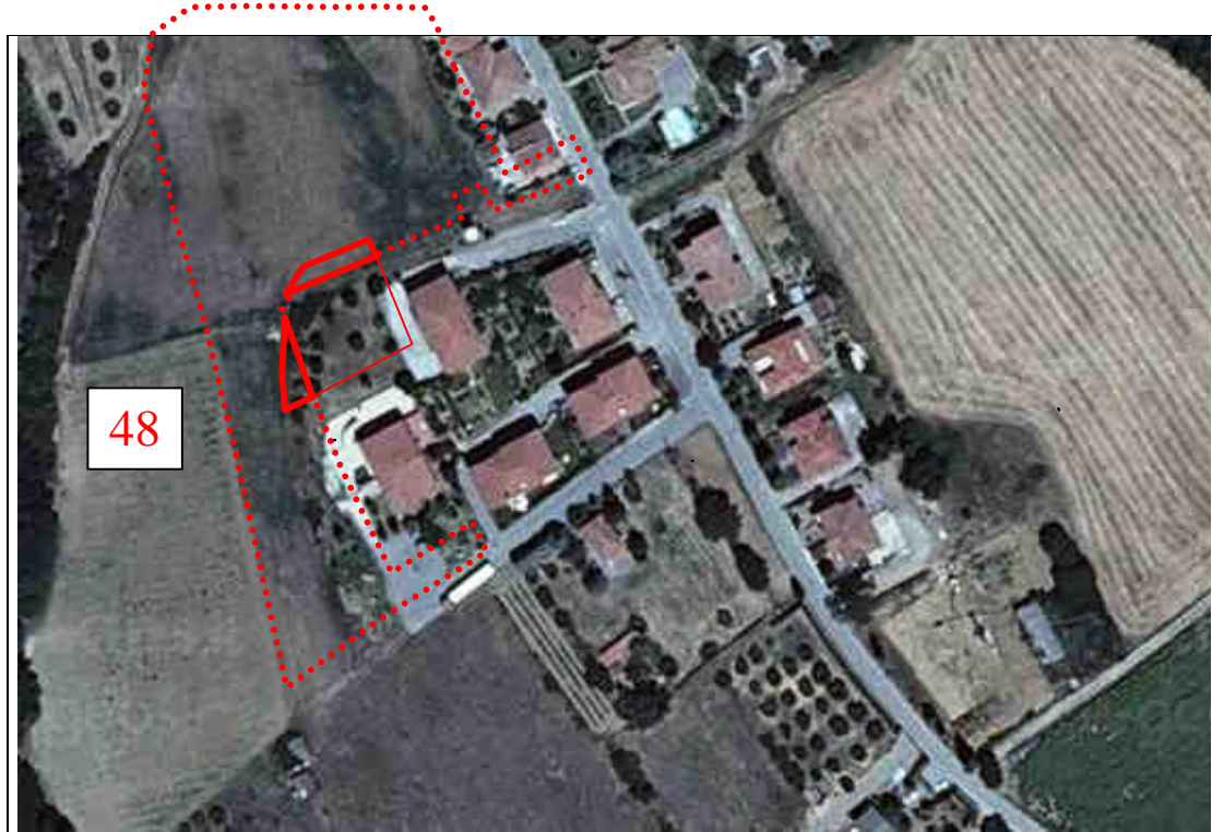
FOTO AEREA CON INDIVIDUAZIONE DELL'AREA INTERESSATA