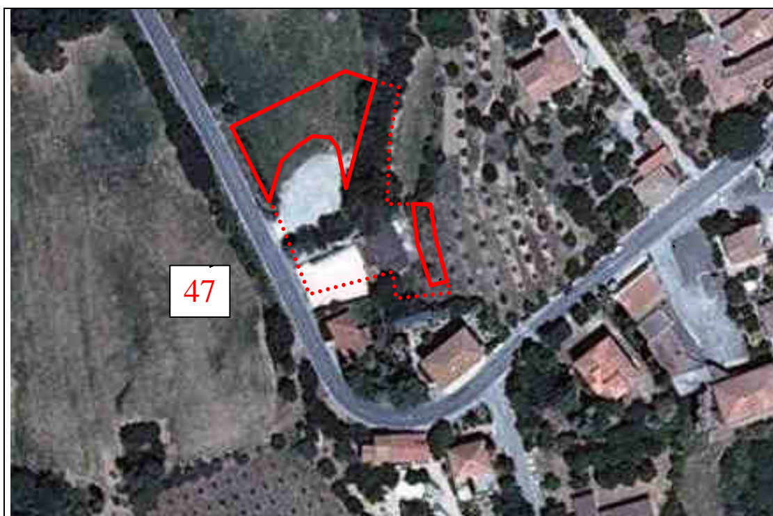
FOTO AEREA CON INDIVIDUAZIONE DELL'AREA INTERESSATA