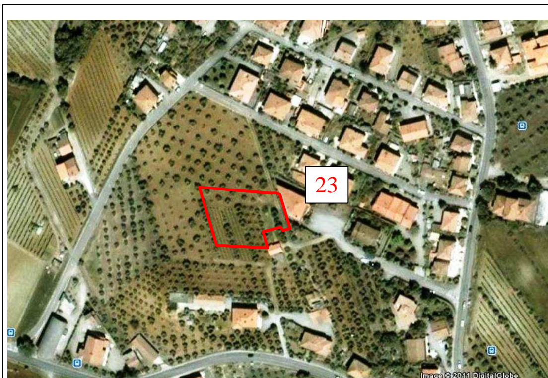
FOTO AEREA CON INDIVIDUAZIONE DELL'AREA INTERESSATA