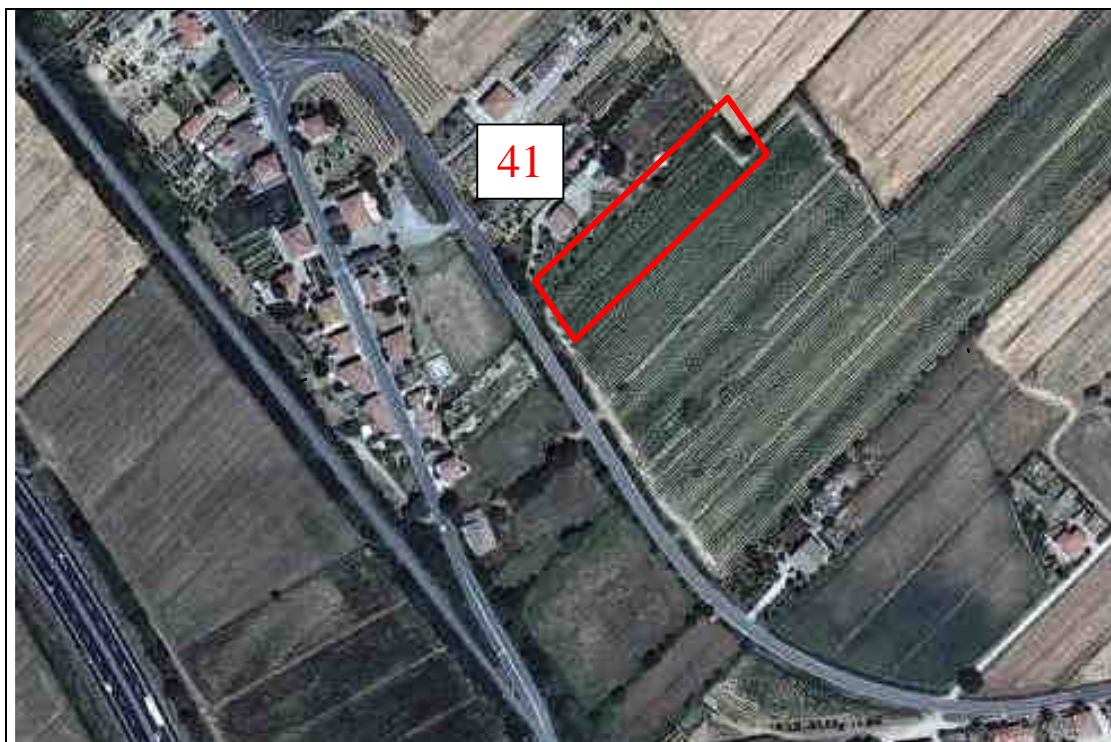
FOTO AEREA CON INDIVIDUAZIONE DELL'AREA INTERESSATA