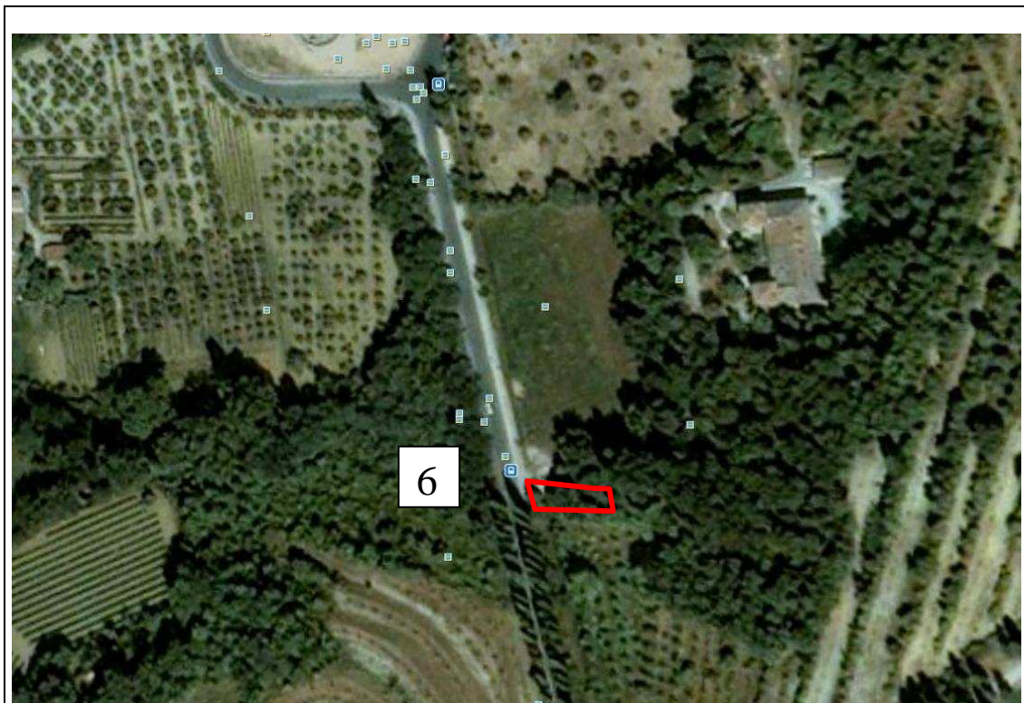
FOTO AEREA CON INDIVIDUAZIONE DELL'AREA INTERESSATA