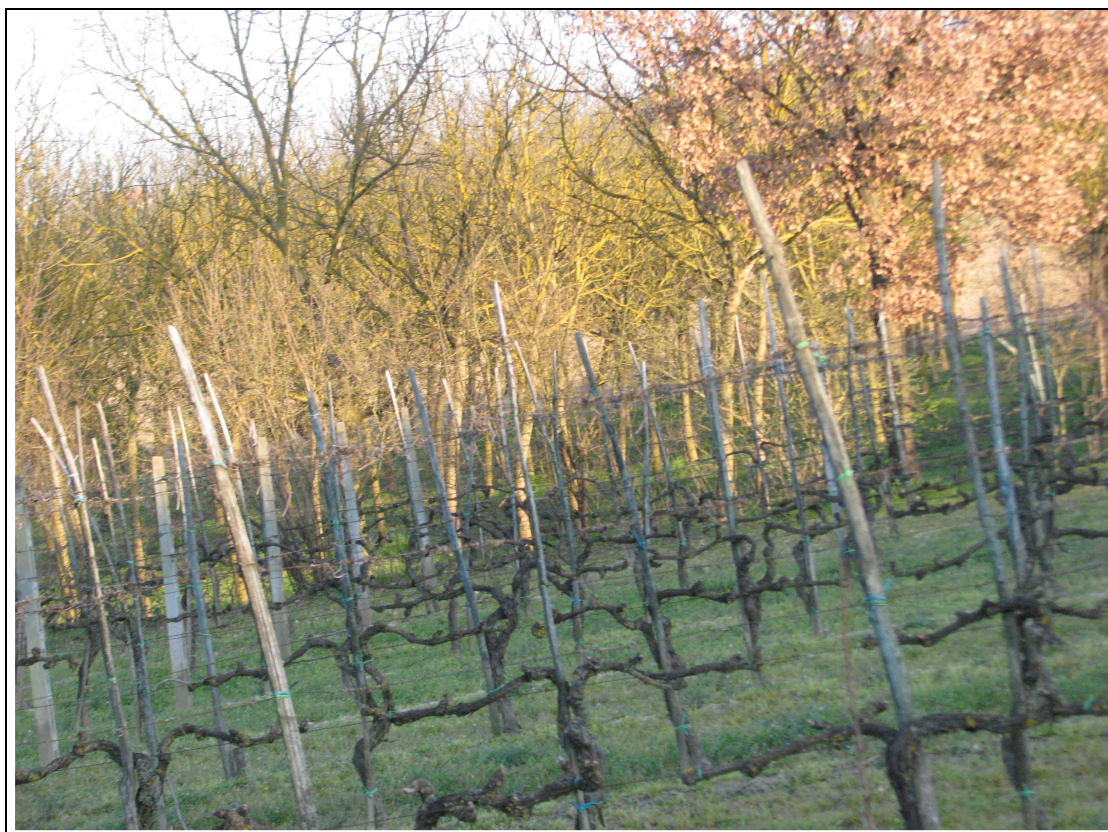
PARTICOLARE FOTOGRAFICO DA VIA SALVO D'ACQUISTO (15)