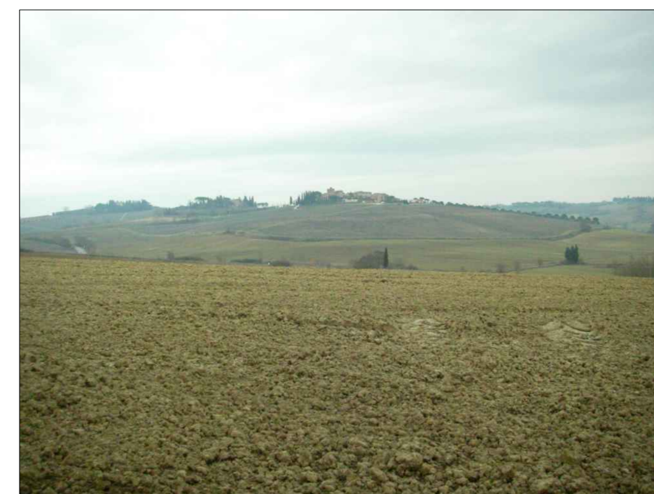
Foto 3 - VISTA DAL PODEWRE IL COLLE