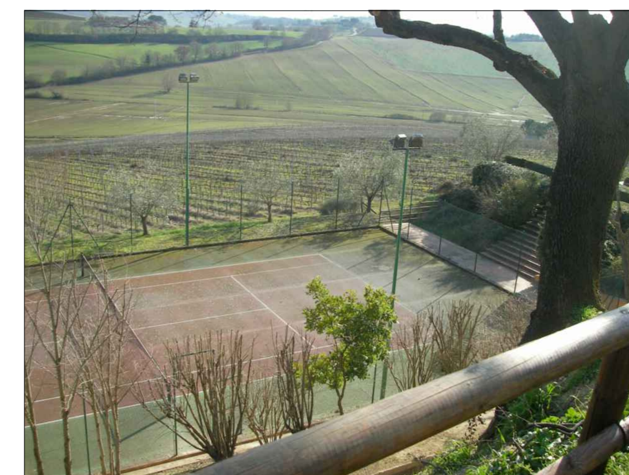
Foto 15 - VISTA DAL CAMPO DA TENNIS