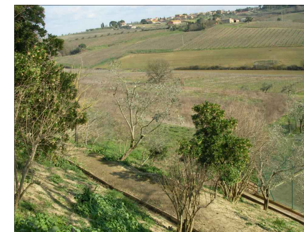
Foto 17 - VISTA DAL LATO SINISTRO VERSO PETRIGNANO