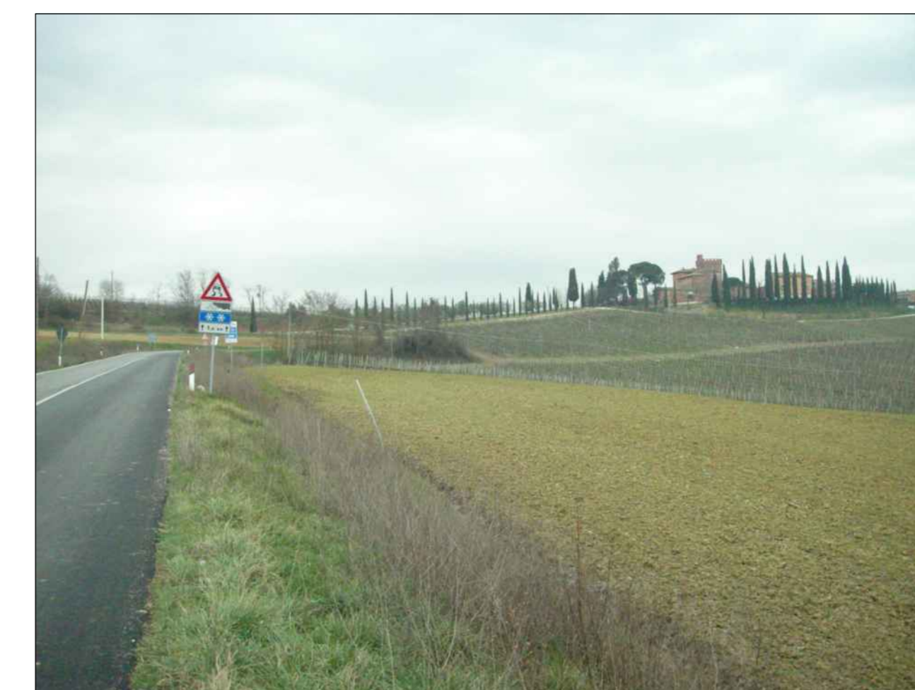
Foto 5 - VISTA DALLA STRADA PER PETRIGNANO