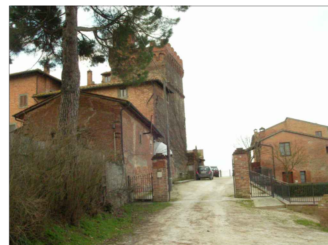
Foto 10 - VISTA DALL'INGRESSO PRINCIPALE AL BORGO