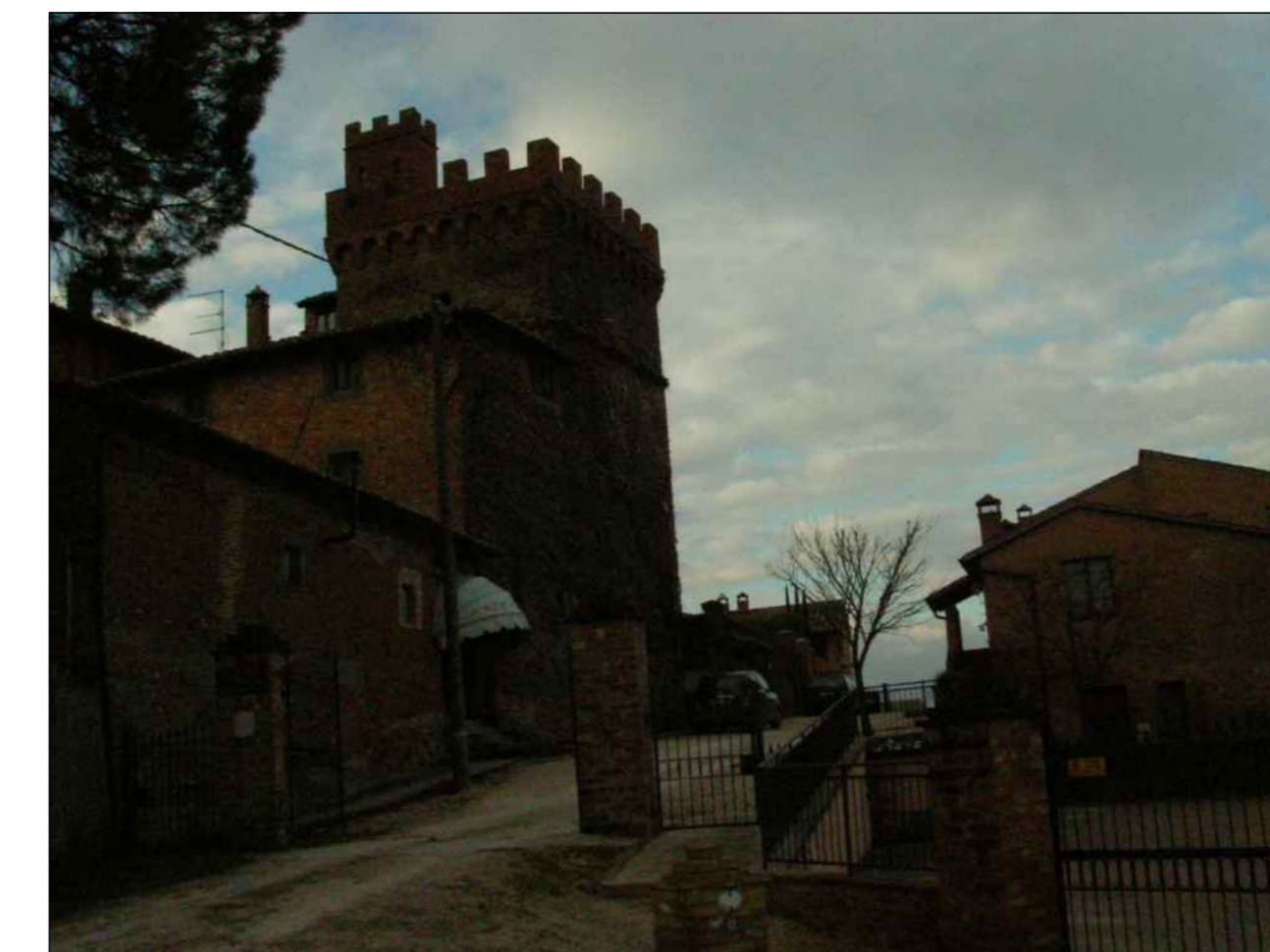
Foto 6 - VISTA DALL'INGRESSO PRINCIPALE AL BORGO