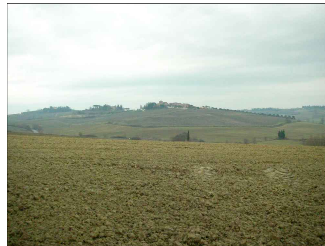
Foto 2 - VISTA DAL PODERE IL COLLE