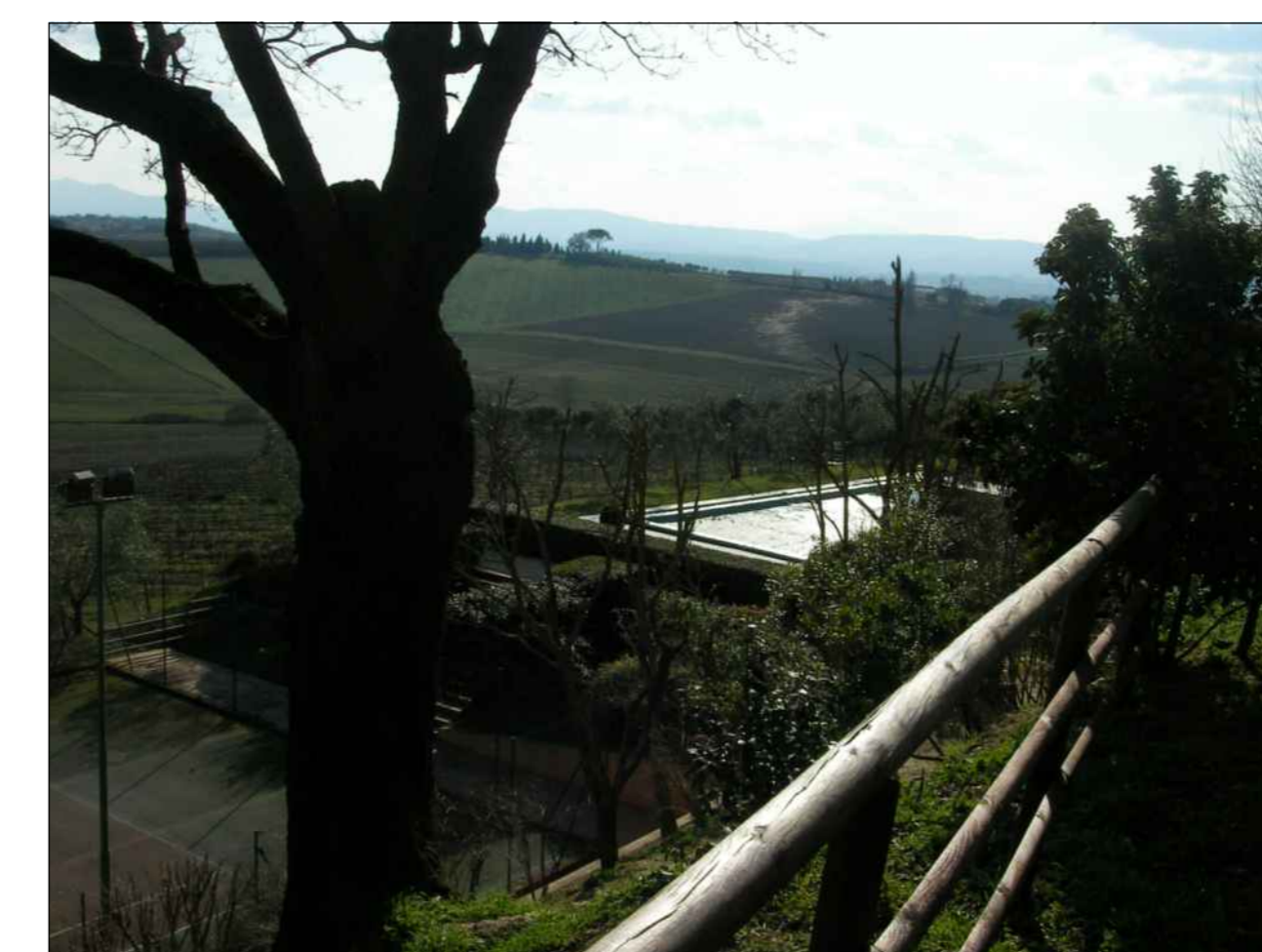
Foto 16 - VISTA ESTERNA DAL CAMPO DA TENNIS