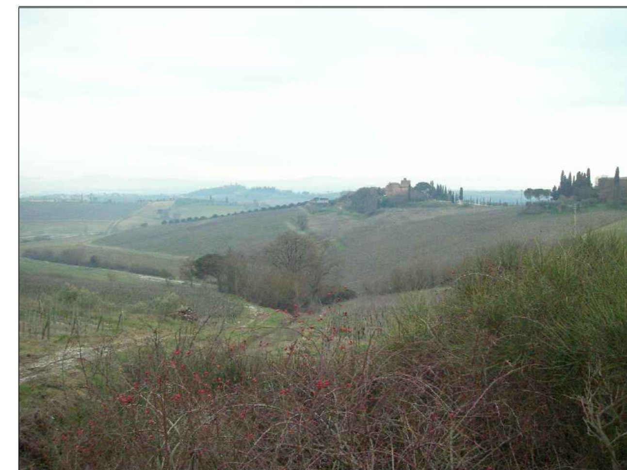
Foto 4 - VISTA DALLA STRADA PER PETRIGNANO