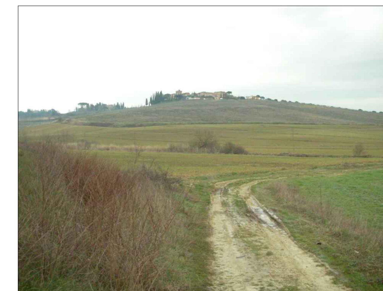
Foto 7 - VISTA DALLA VIA LAURETANA