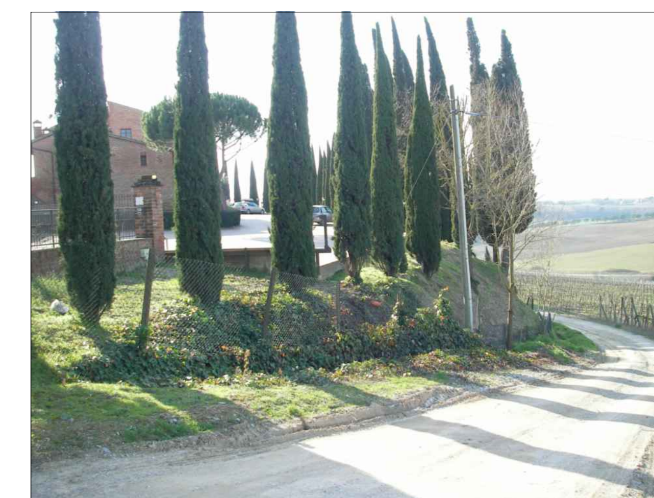
Foto 18 - VISTA DALL'INGRESSO PRINCIPALE