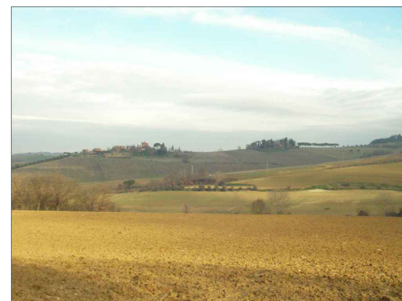
Foto 9 - VISTA DAL PODERE IL COLLE