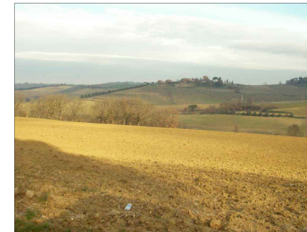
Foto 8 - VISTA DAL PODERE IL COLLE