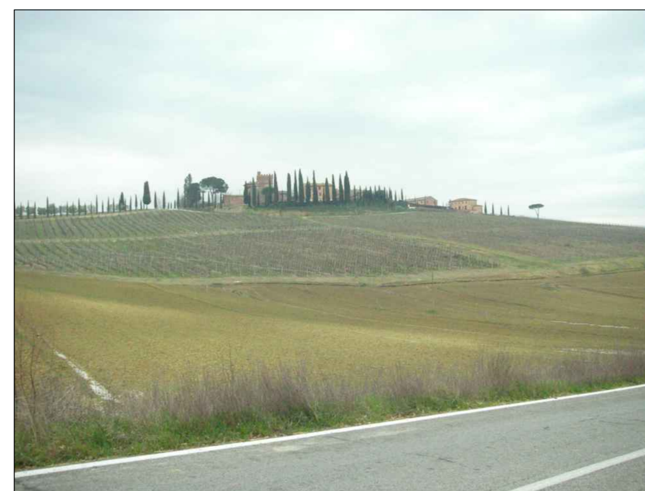
Foto 1 - VISTA DA VIA LAURETANA