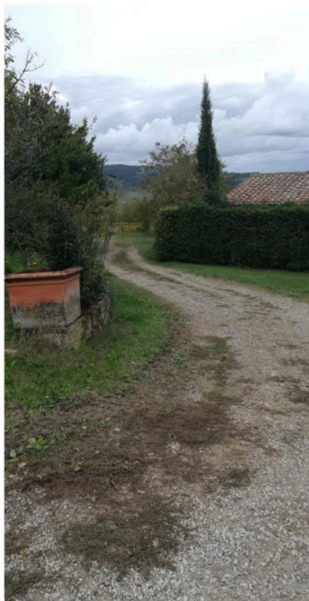
Foto 2 - Accesso da zona antistante abitazione principale