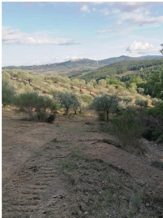
Foto n. 4 - Vista dell'oliveto e del bosco - Comune di Torrita