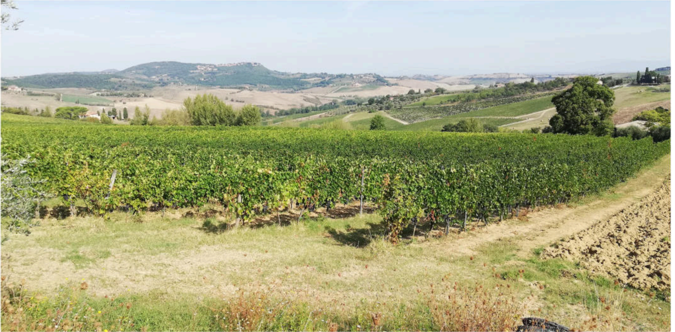
Foto n. 1 - Vista vigneto