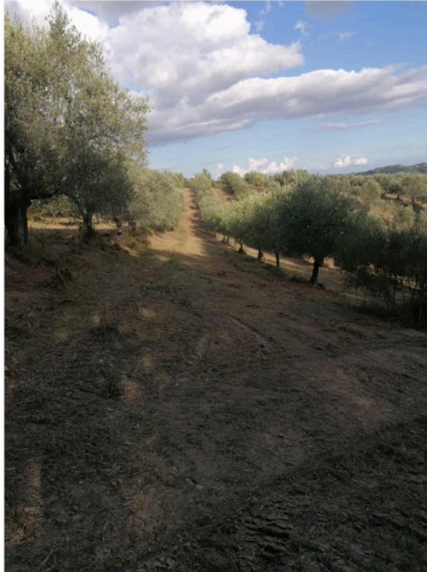
Foto n. 3 - Vista dell'oliveto- Comune di Torrita