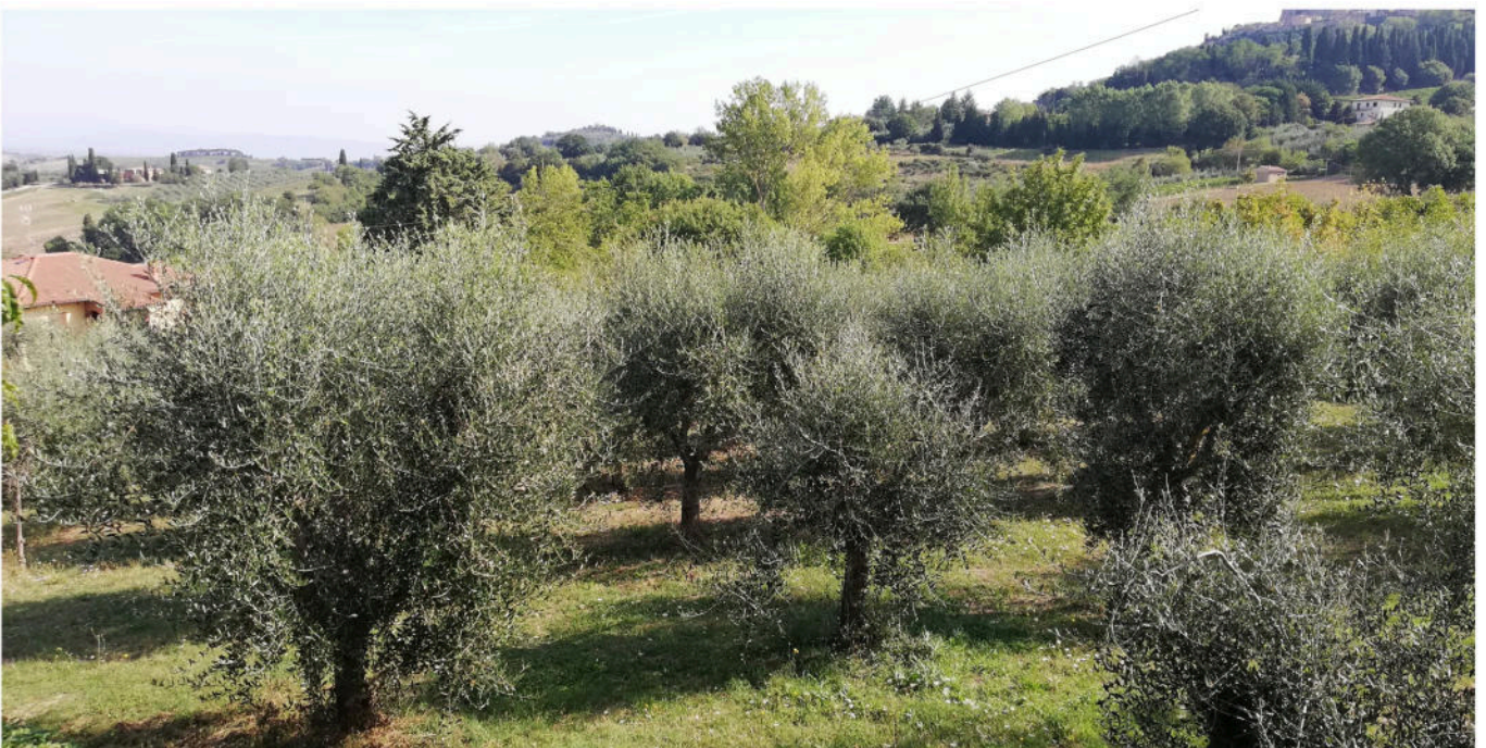
Foto n. 2 - Vista oliveto - Comune di Montepulciano