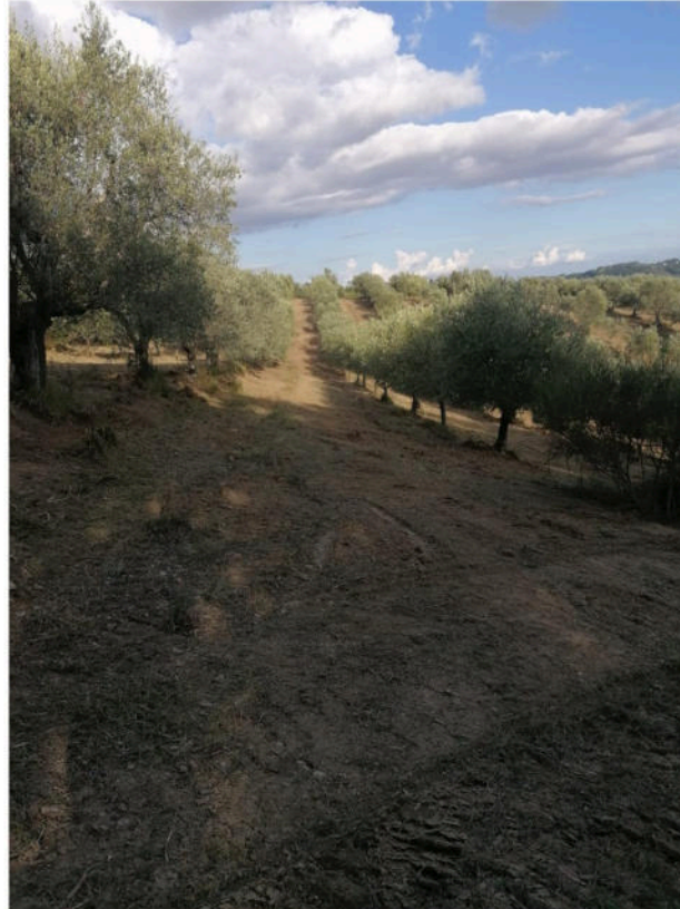
Foto n. 3 - Vista dell'oliveto- Comune di Torrita