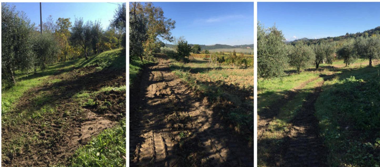
Foto 1 - Passaggio campestre esistente da trasformare in stradella imbrecciata