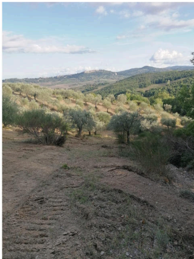
Foto n. 4 - Vista dell'oliveto e del bosco - Comune di Torrita