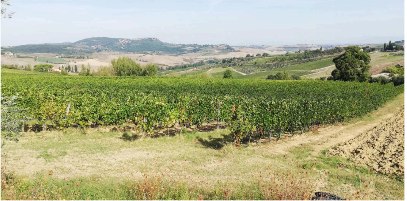
Foto n. 1 - Vista vigneto - Comune di Montepulciano