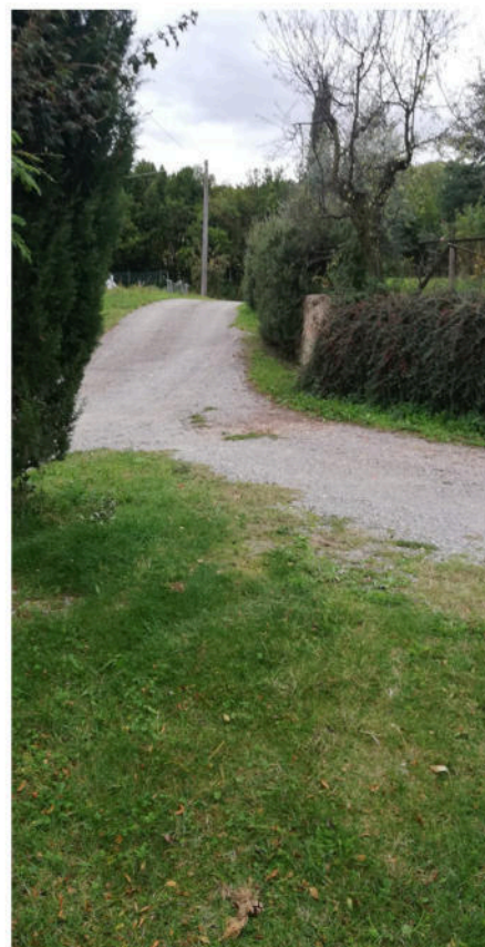
Foto 3 - Accesso da Via di Pescaia - partenza tratto di nuova stradella interna