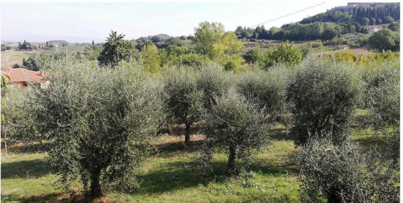
Foto n. 2 - Vista oliveto - Comune di Montepulciano