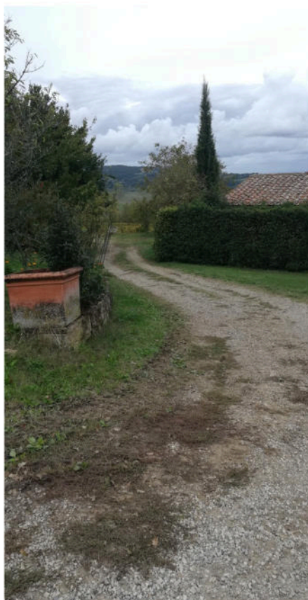
Foto 2 - Accesso da zona antistante abitazione principale