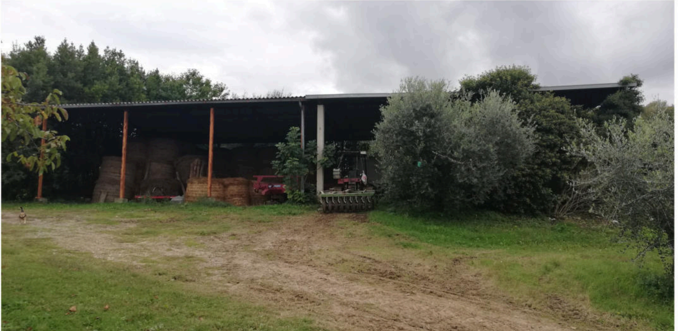
Foto n. 3 - Vista area oggetto di intervento ANTE OPERAM - Comune di Montepulciano