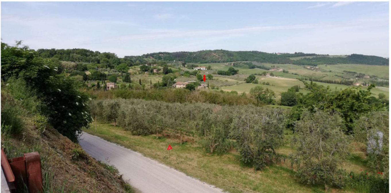
Foto n. 2 - Vista area da Via dei Canneti - POST OPERAM - Comune di Montepulciano