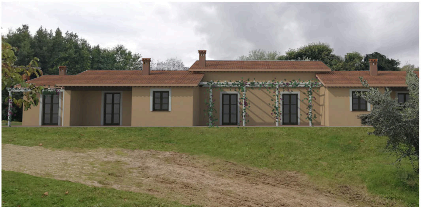
Foto n. 4 - Vista area oggetto di intervento POST OPERAM - Comune di Montepulciano