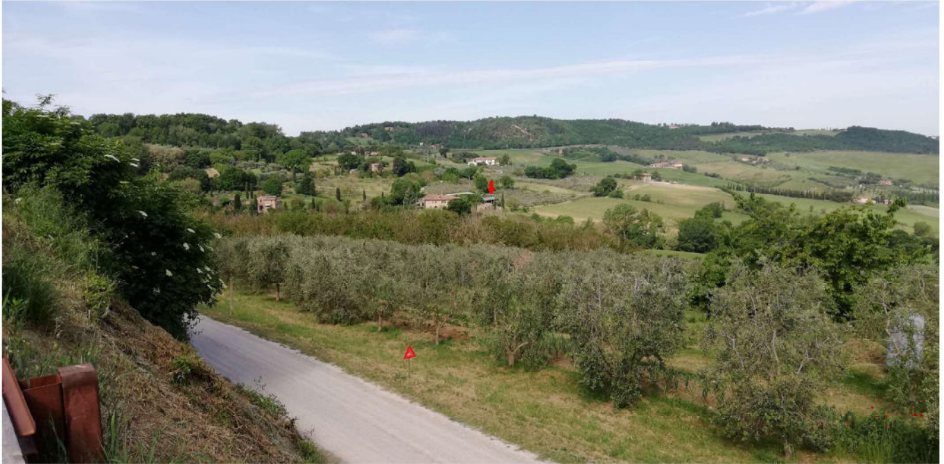
Foto n. 1 - Vista area da Via dei Canneti - ANTE OPERAM - Comune di Montepulciano