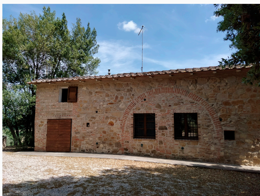
FOTO Immagini dalle varie angolazioni dell' immobile