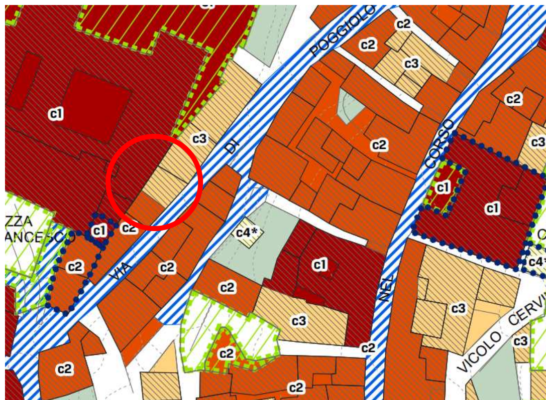
IMMAGINE 9 – Piano Operativo.-