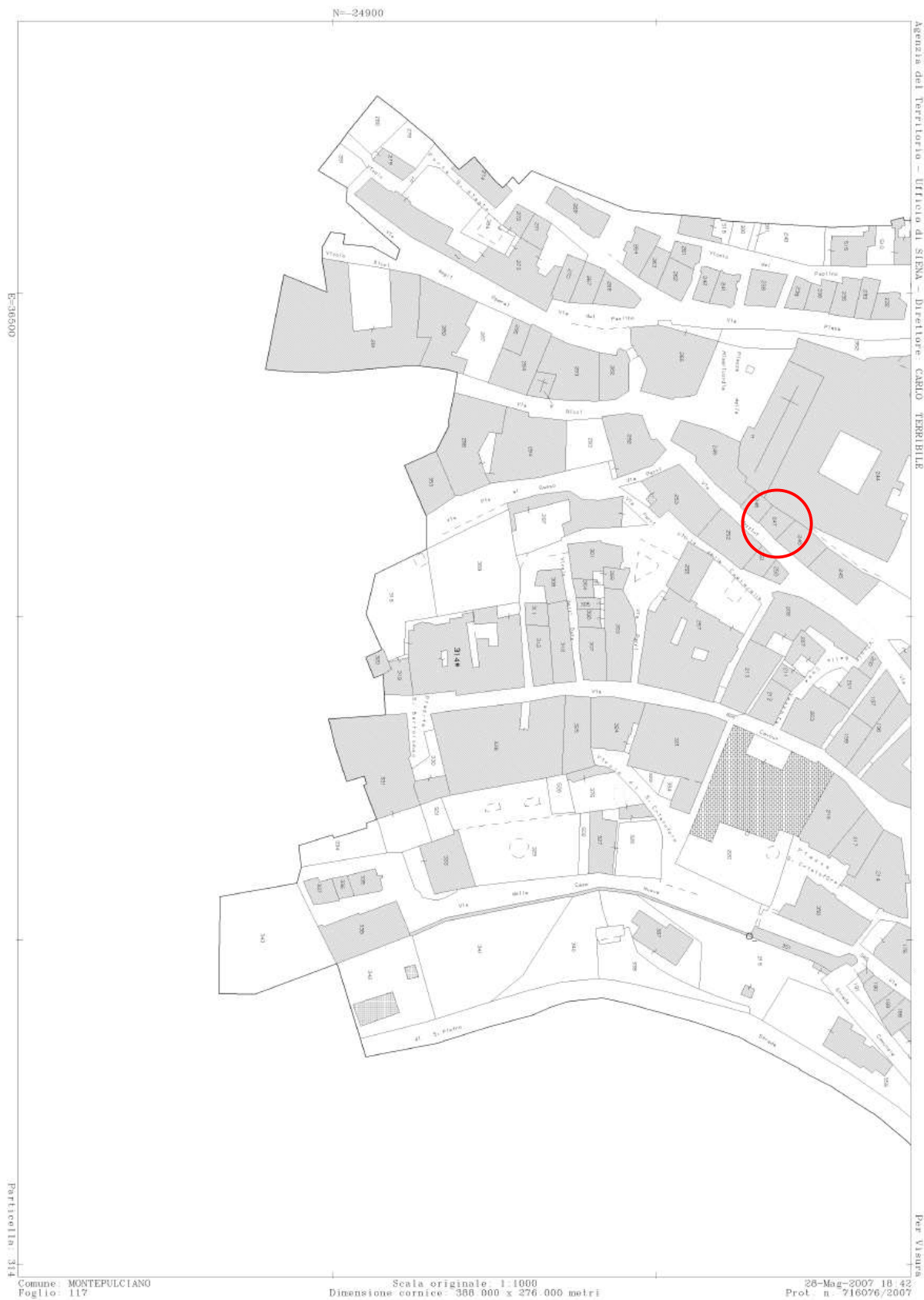
IMMAGINE 1 – Mappa catastale.-