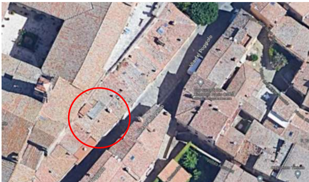
IMMAGINE 9 - Veduta aerea dell'edificio.-