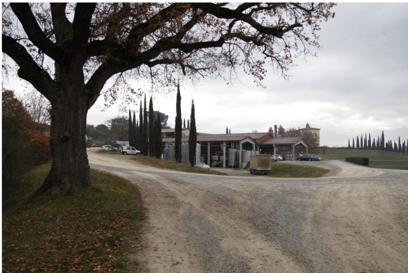
S t a t o A t t u a l e