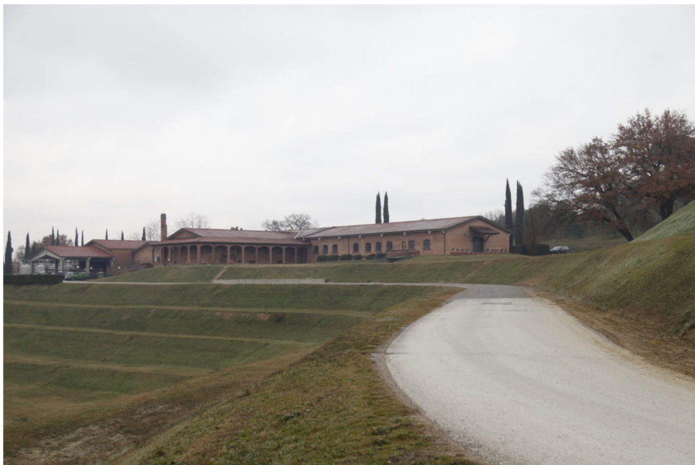
S t a t o A t t u a l e