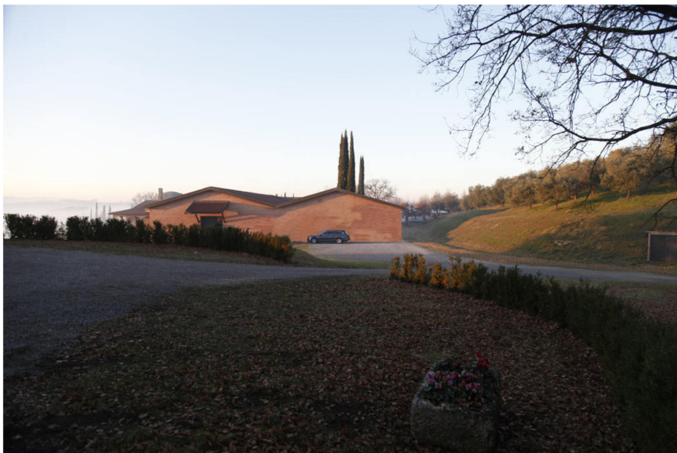
S t a t o d i P r o g e t t o