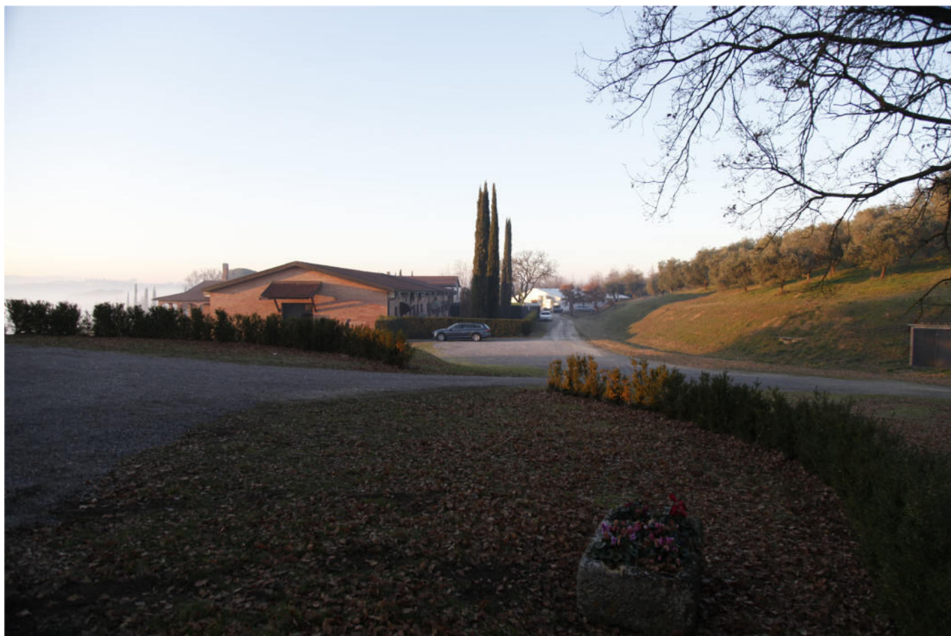
S t a t o A t t u a l e