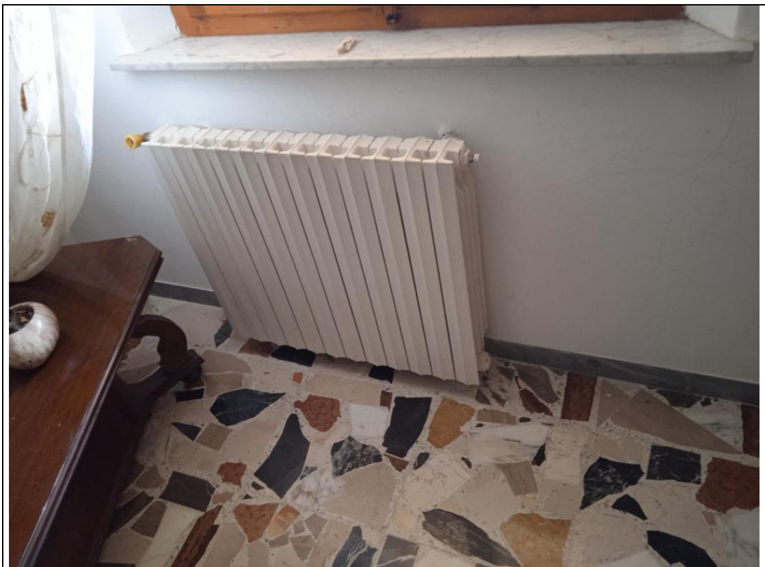
INTERNI DEL PIANO PRIMO - PAVIMENTI R FINITURE