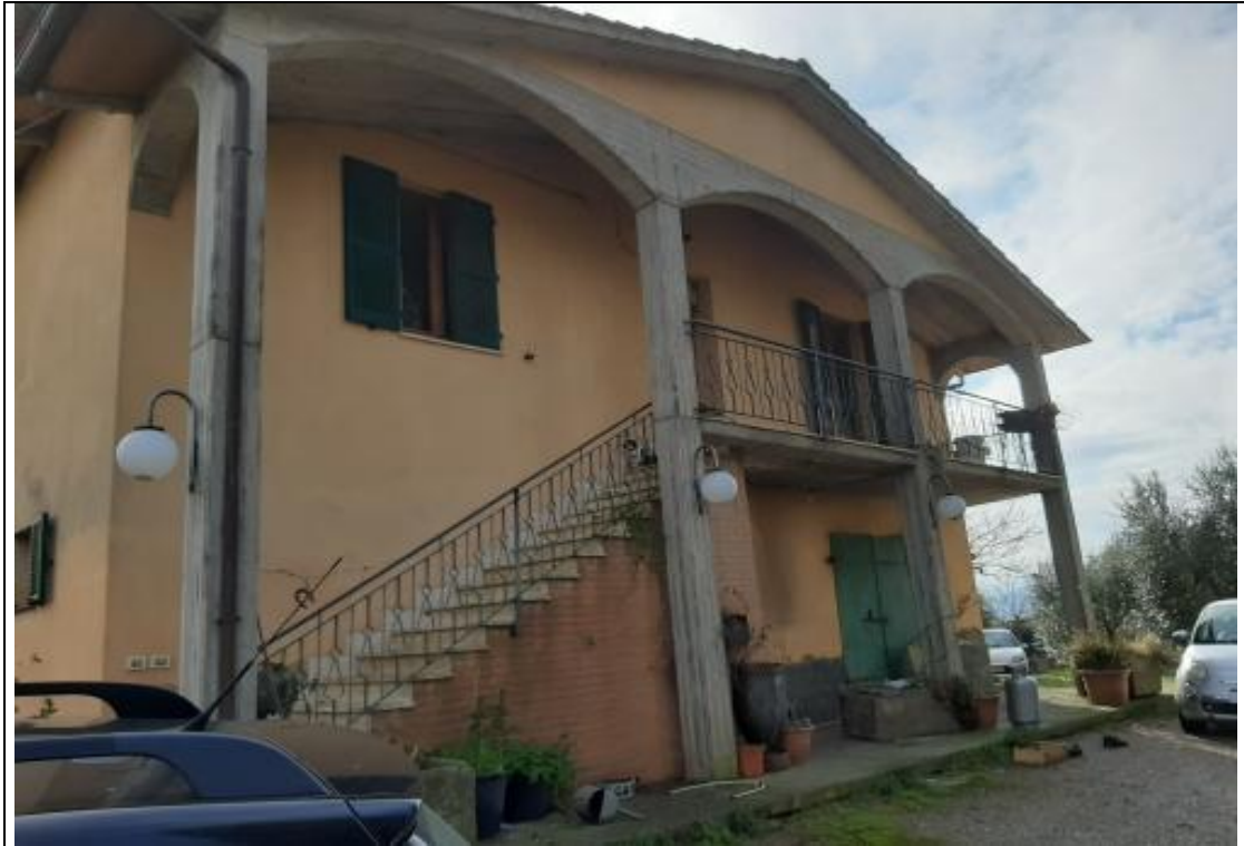
LATO OVEST - FABBRICATO PRINCIPALE