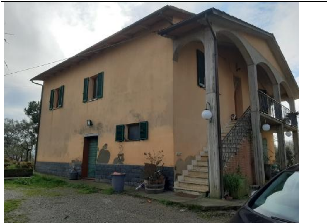
LATO NORD ED OVEST DEL FABBRICATO PRINCIPALE