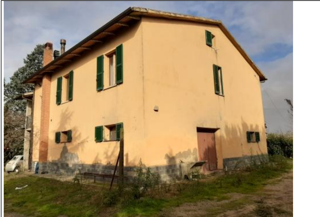
LATO EST E SUD DEL FABBRICATO PRINCIPALE