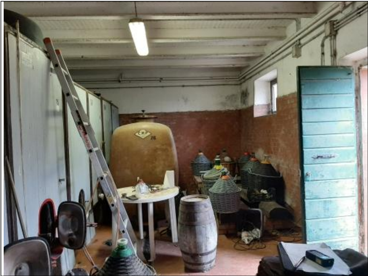
INTERNI DEL PIANO TERRA- SOLAIO